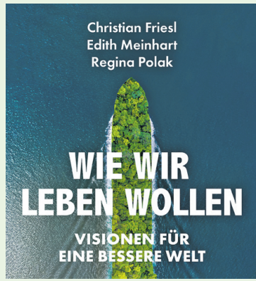
Cover/Verlag edition a